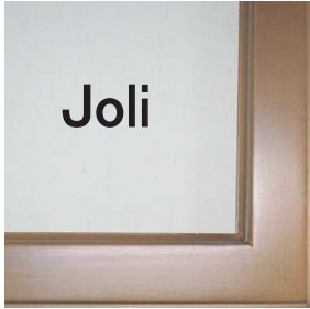
Color : ブラウン