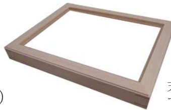
J01-5 素地 (無塗装)

天然木の素地 (無塗装) の状態の商品です。自由にペイントや加工をすることができます。