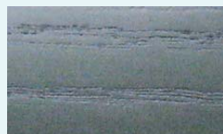
EL-1 フォレストグリーン