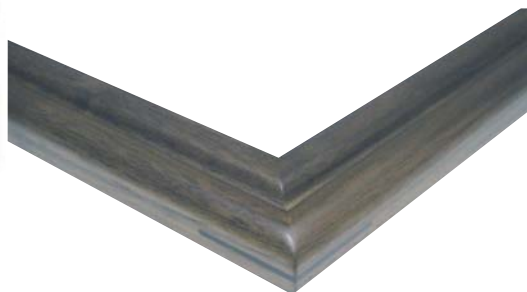
□ 素材：ウォールナット天然無垢材

強度と安定性を兼ね備えた良質素材でありヨーロッパではルネッサンスの時代から家具用材として広く使用され、古くから銘木とされて来ました。チョコレート色の濃い色合いと、時折表れる縞状の木目模様が高級感を醸し出し、職人の手で一枚一枚丁寧に磨き上げたフレームは、美しい輝きを映し出します。