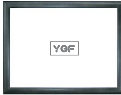
ダークインディゴ