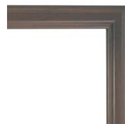
MS-4 フレンチブラウン