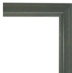
MS-3 フレンチグリーン