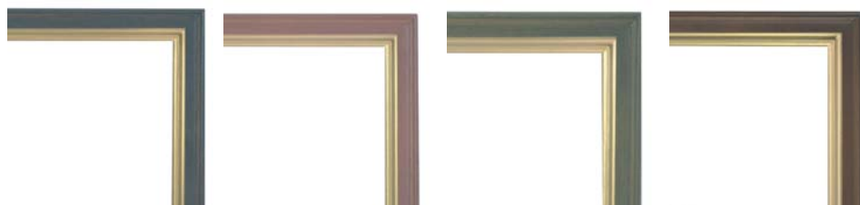
MSG-1 フレンチブルー-G MSG-2 フレンチローズ-G MSG-3 フレンチグリーン-G MSG-4 フレンチラベンダー-G