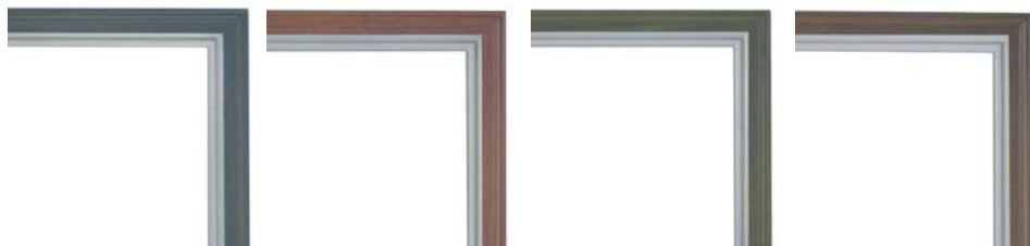
MSG-5 フレンチブルー-S MSG-6 フレンチローズ-S MSG-7 フレンチグリーン-S MSG-8 フレンチラベンダー-S