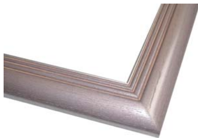
パールメタリックカラー