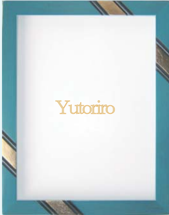
SB30-1 オーシャンブルー