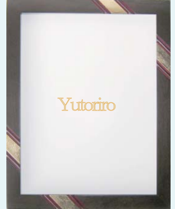
SB30-4 チョコレートブラウン