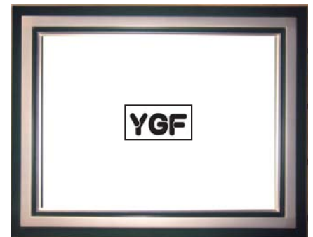
SR02-6 ハンターグリーン-S