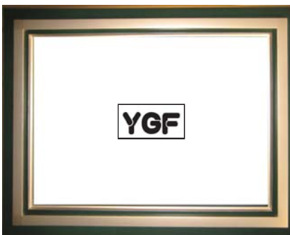
SR02-3 ハンターグリーン-G