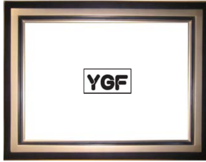
SR02-1 ダークナイトブルー-G