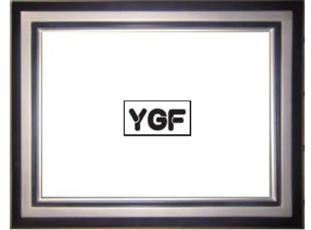
SR02-4 ダークナイトブルー-S